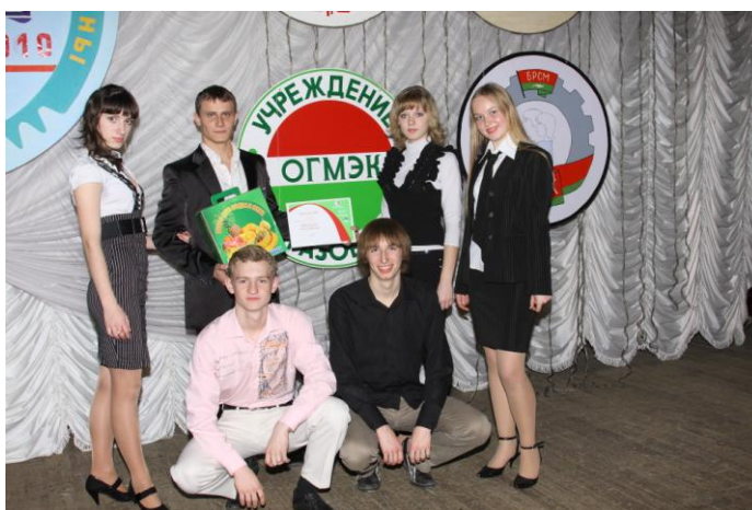
Городской конкурс «Оршанский первоцвет». Апрель 2010 г. В номинации «Танец» учащиеся колледжа завоевали 1 и 3 места; в номинации «Декламация» - 3 место; в номинации «Сольное пение», «Вокальное пение» стали дипломантами.

Доброй традицией стали в колледже встречи выпускников прошлых лет. Ведь во многом история любого учебного заведения – это его выпускники, их жизненный и профессиональный путь.