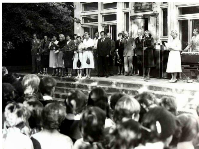
Линейка, посвященная 1 сентября. Фото 1985 г.

Большую роль в успешном проведении учебно-воспитательного процесса играло тогда социалистическое соревнование. В техникуме была разработана система социалистического соревнования между учебными группами, кабинетами и лабораториями, цикловыми комиссиями и отделениями. В общежитии – за лучший этаж, комнату.