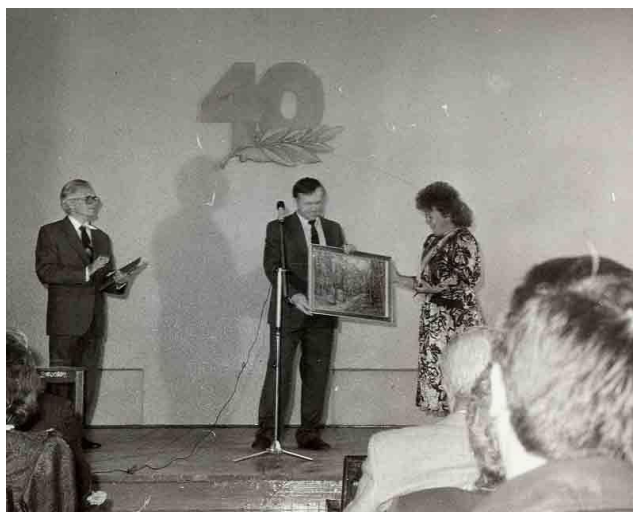
На торжественном вечере, посвященном 40-летию техникума. Фото 1994 г.