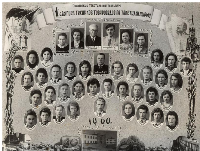
Фотографии первых выпусков техникума.

4 августа 1958 года техникум был передан в ведение Министерства высшего и среднего специального образования СССР и готовил специалистов по дневной, вечерней формам обучения. Была открыта специальность «Машины и аппараты легкой, текстильной промышленности и бытового обслуживания».