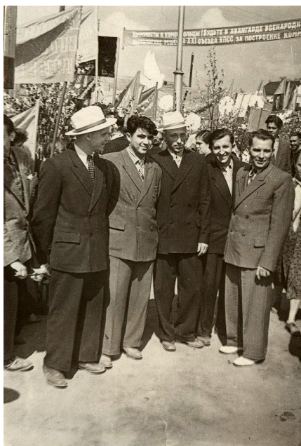
Преподаватели техникума на демонстрации. Фото начала 1960-х гг.

Преподавательским коллективом был накоплен большой опыт работы с учащимися-заочниками. Специалисты, окончившие техникум по заочной форме, успешно трудились на ответственных руководящих и технологических должностях. Среди них, в первую очередь, работники Оршанского льнокомбината: