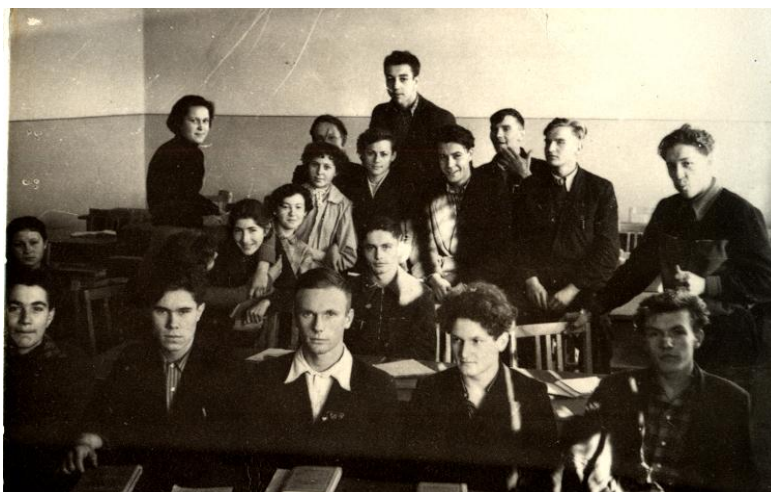
На перемене в группе техников-механиков. Фото 1957 г.