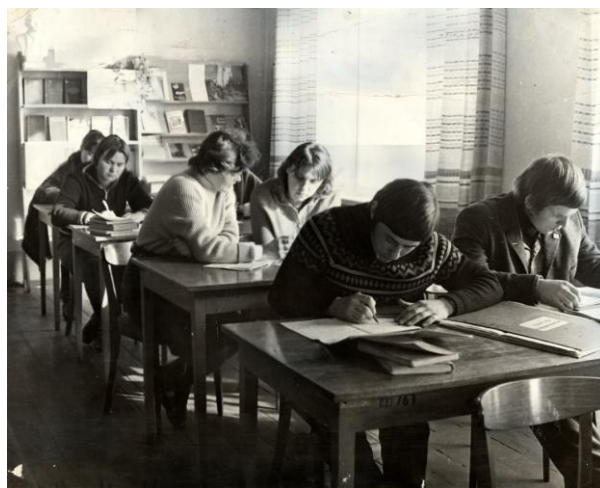
В библиотеке. Фото 1970-х гг.

На основании приказа №256 от 13 июня 1973 года Оршанский текстильный техникум был переименован в Оршанский механико-технологический техникум, который готовил специалистов по 7 специальностям на трёх отделениях: дневном, вечернем и заочном.