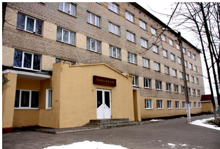
Общежитие. Фото 2011 г.

В 1968 году было сдано в эксплуатацию новое четырёхэтажное здание по улице Советской, 81. Первые занятия в нем прошли 30 апреля 1968 года. В 1970 году было сдано в эксплуатацию пятиэтажное здание общежития, в котором позднее на первом и втором этажах были оборудованы учебные аудитории. В основном по дисциплинам общеобразовательного цикла. Здесь же расположена и столовая учебного заведения.