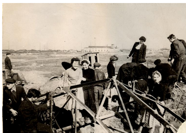
Преподаватели и учащиеся на субботнике. Фото 1959 г.

Преподавательский коллектив был небольшой. В те годы условия работы были сложными: отсутствовали лабораторная учебная база, наглядные пособия, технические средства обучения. Однако, несмотря на большие трудности, педагогический коллектив с задачей подготовки кадров справился успешно.