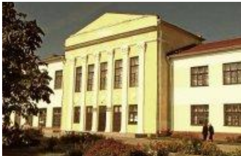
Здание лицея текстильщиков. Современное фото.

В 1956 году было основано дневное отделение по специальности «Технология первичной обработки лубяных культур» на базе 10 классов и 7 классов, выпускавшая техникумов-механиков.