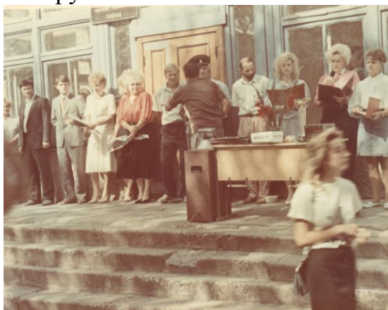
Линейка, посвященная 1 сентября.

В соответствии с Постановлением Совета Министров Республики Беларусь от 07.02.1992г. №64 Оршанский государственный механико-технологический техникум передан в республиканскую собственность и подчинен Министерству образования Республики Беларусь.