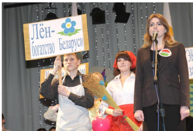
Городской конкурс среди учащихся ССУЗов и ПТУ «Парад профессий».