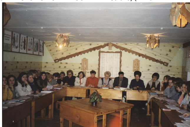
На открытом уроке. Фото начала 2000-х гг.

2 августа 2002 года приказом Министерства образования Республики Беларусь №308 техникум был переименован в учреждение образования «Оршанский государственный механико-экономический колледж».