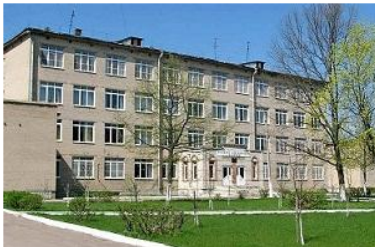
Учебный корпус. Фото 2011 г.

В 1967 году была открыта специальность «Бухгалтерский учет, анализ и контроль».